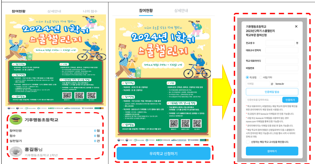
② 나와 학교의 참여현황 확인