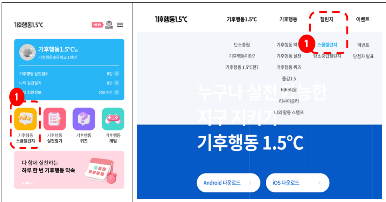
① 메인화면에서 버튼 선택(앱) / 챌린지>스쿨챌린지 선택(웹페이지)